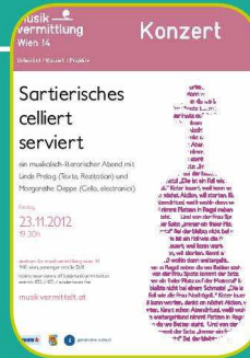
23.11. Sartierisches celliert serviert