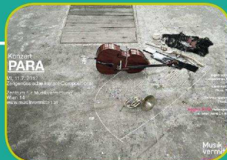
11.7. PARA Instant-Compositions