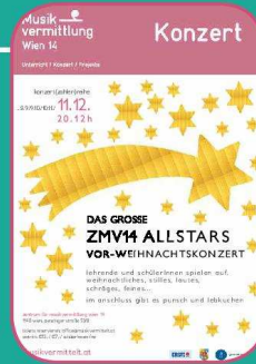
11.12. ZMVM14 Allstars Vor-Weihnachtskonzert