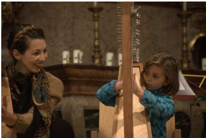
Adventkonzert in Maria Hietzing