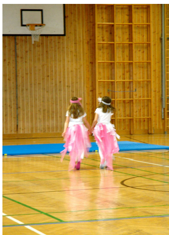
Musical macht Schule