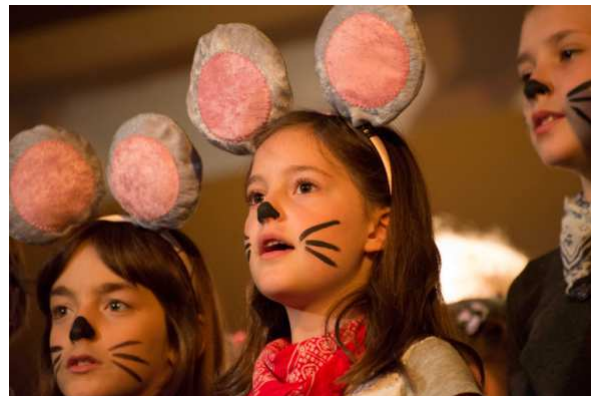
Max und die Käsebande